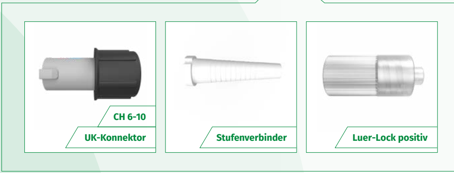
CH 6-10 UK-Konnektor

Unsere Urinbeutel bieten vielseitige Konnektionsmöglichkeiten für verschiedene Anwendungsgebiete.